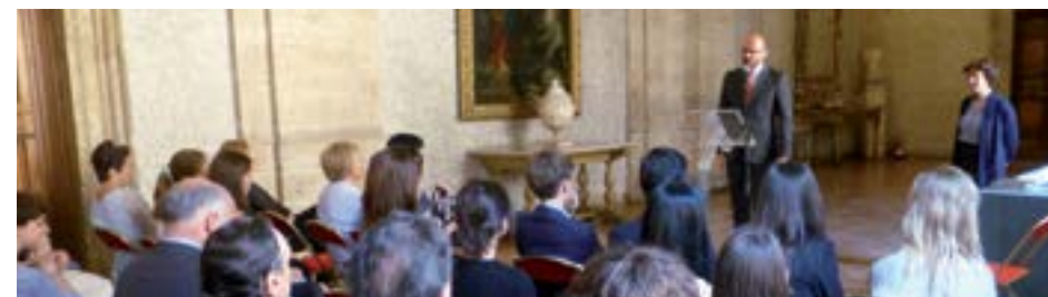
Prix Fiction historique