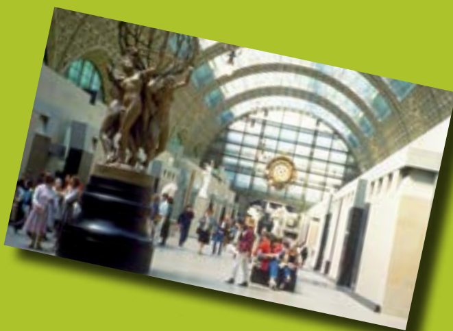
Musée d'Orsay